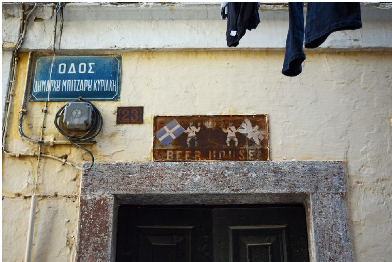
Το Beer House.

Η δεύτερη πινακίδα, “Όινοι Εκλεκτοί Ιθάκης και Κερκύρας διαφόρων ειδών” απευθύνεται στη ντόπια πελατεία που ψώνιζε με τα γυάλινα μπουκάλια πολλαπλής χρήσης.