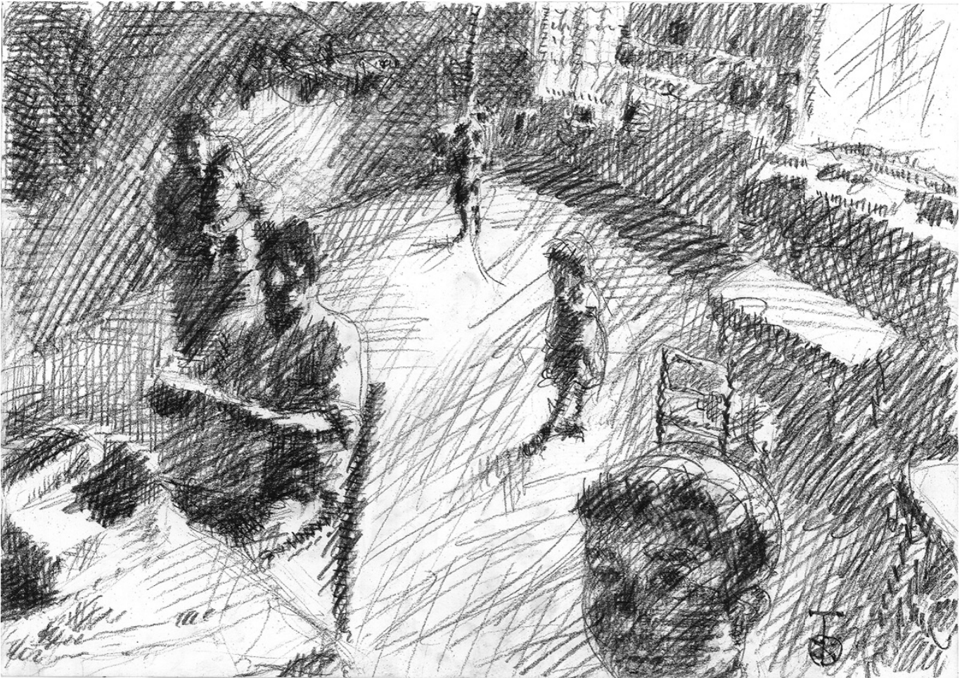
Οικογένεια στο κουζίνι Οικογένεια στο κουζίνι