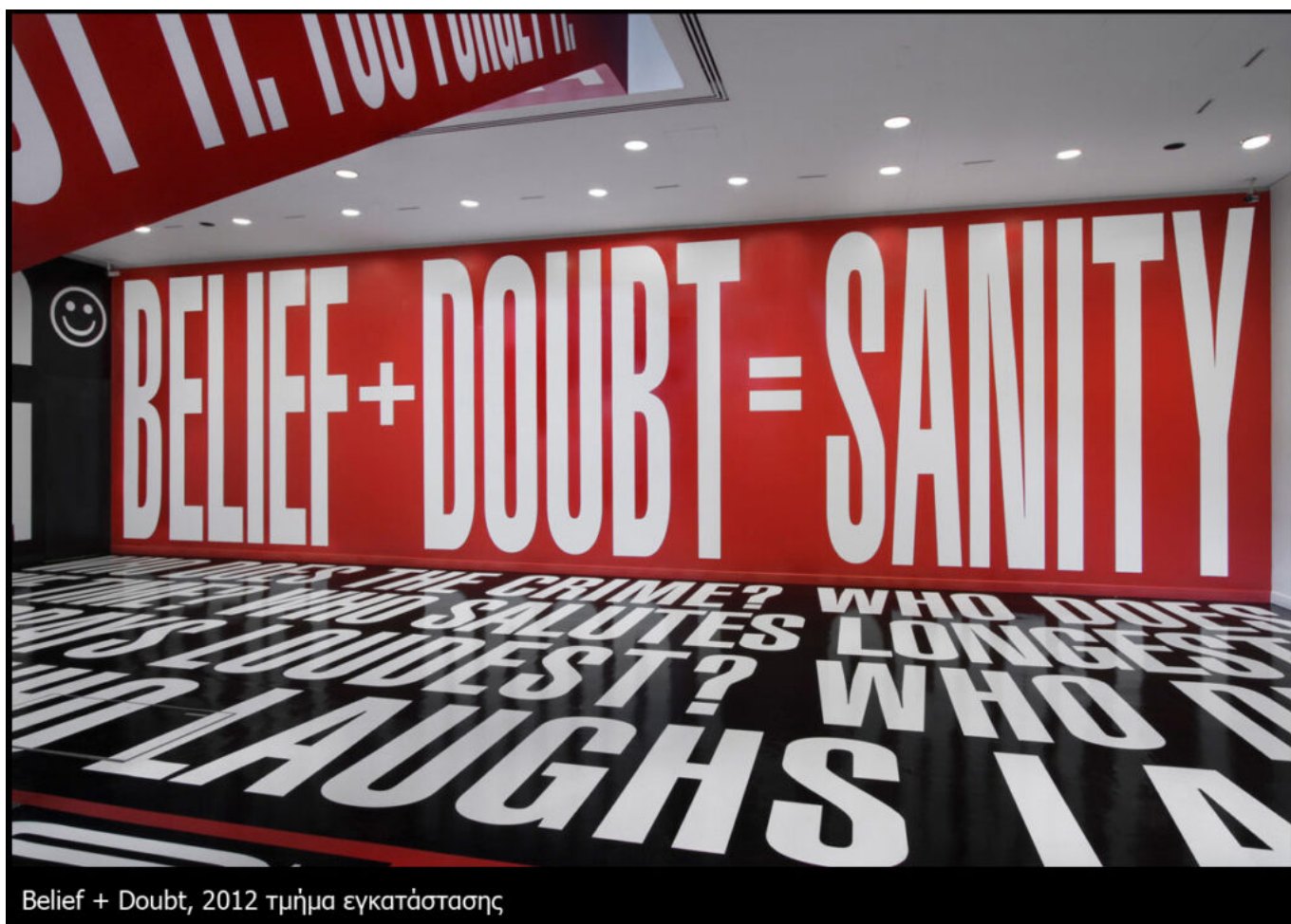
Belief + Doubt, 2012 τμήμα εγκατάστασης