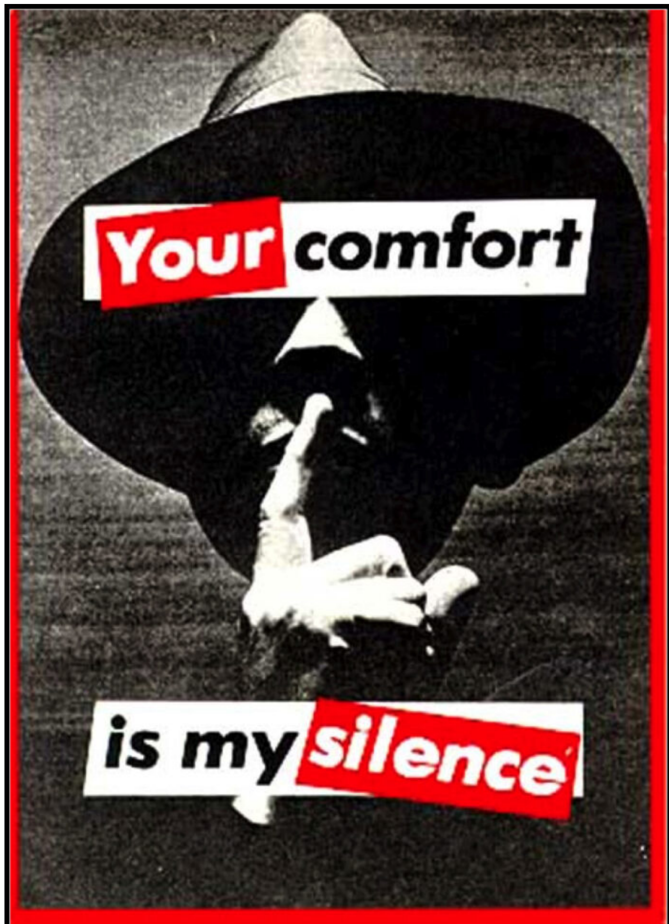
Untilted (your comfort is my silence), 1981