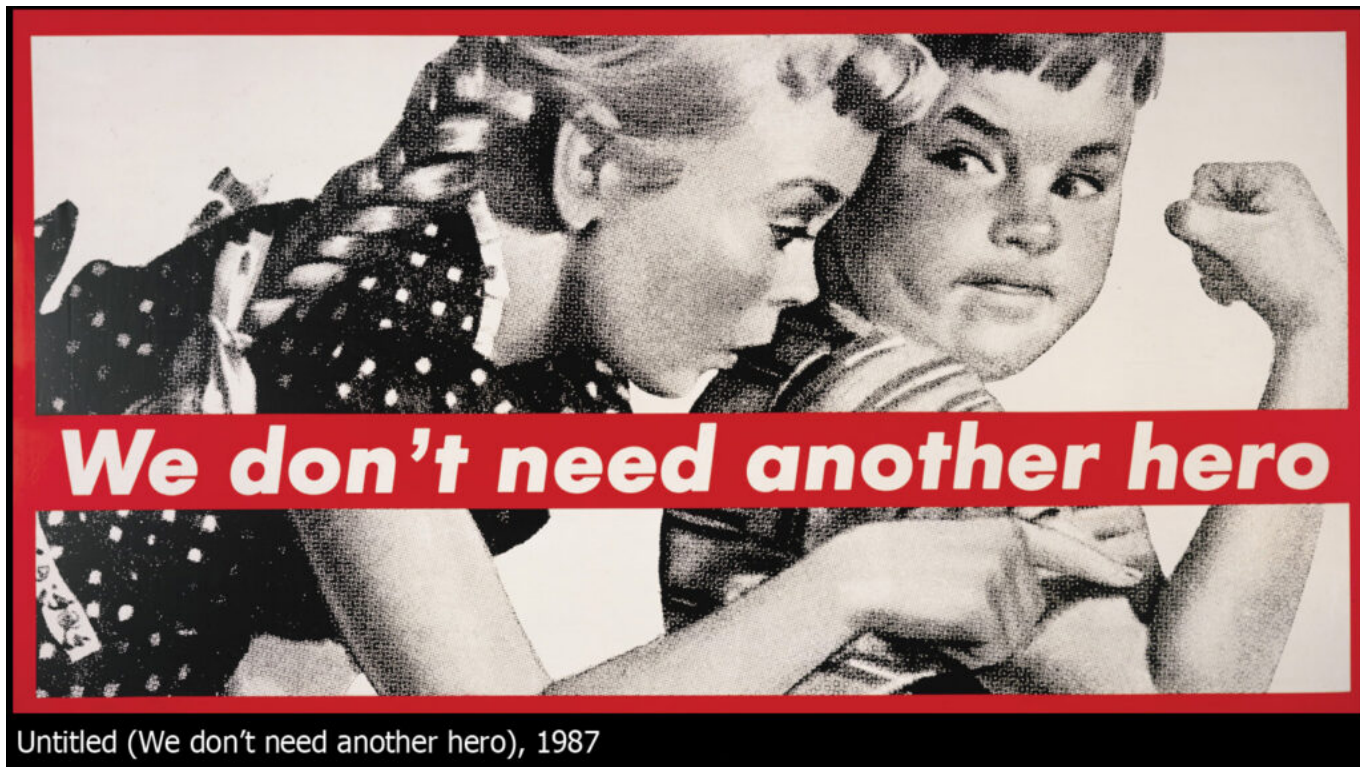
Untitled (We don't need another hero), 1987