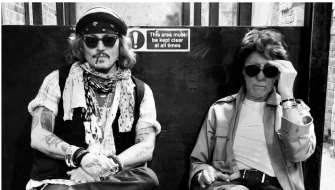
Τζεφ Μπεκ και Τζόνι Ντεπ

Σχετικά με τον τίτλο του άλμπουμ “18”, ο Μπεκ είχε πει: “Όταν ο Τζόνι κι εγώ αρχίσαμε να παίζουμε μαζί, αυτό πυροδότησε το νεανικό μας πνεύμα και τη δημιουργικότητά μας. Αστειευόμασταν για το πώς νιώθαμε σα να ήμασταν ξανά 18 χρονών, κι έτσι αυτό έγινε και ο τίτλος του άλμπου μας”.